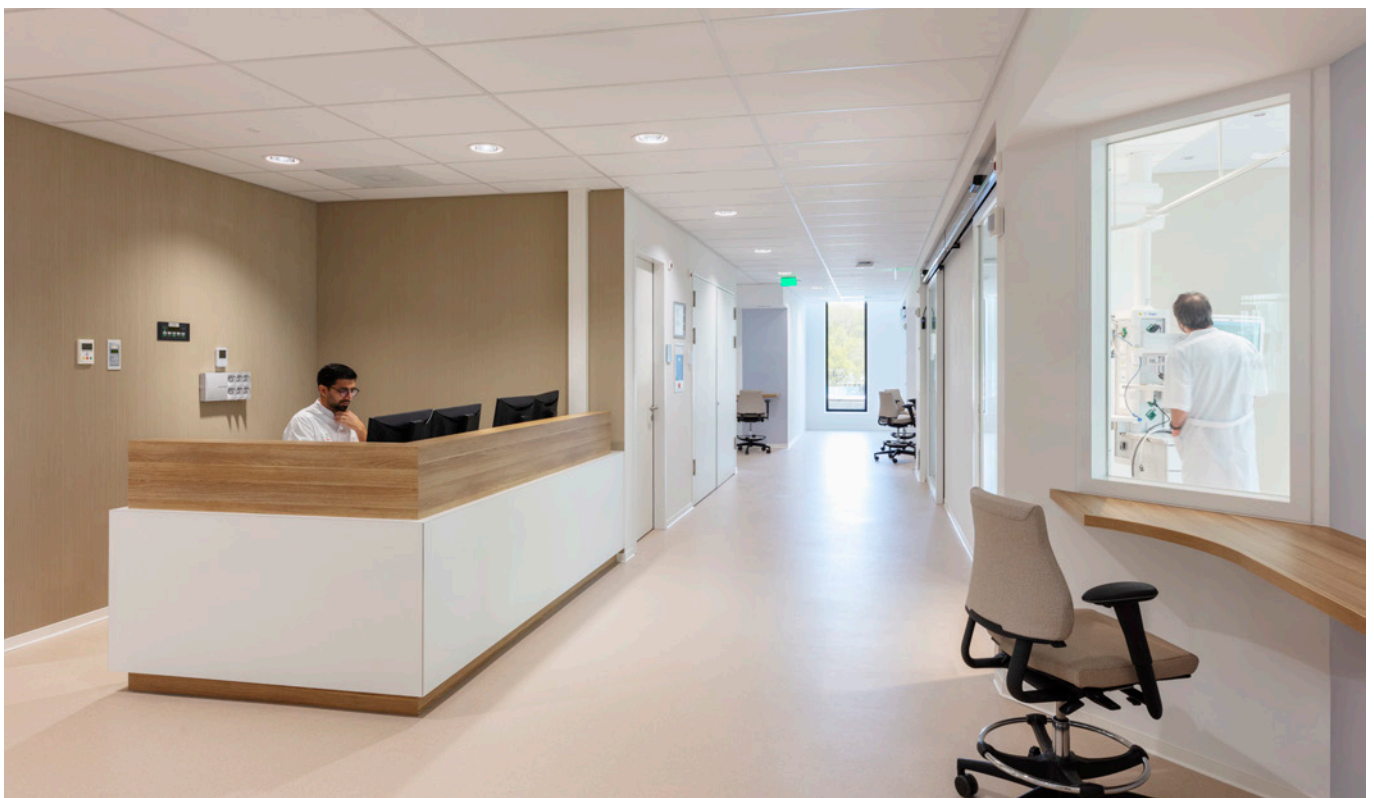
IC-afdeling met decentrale verpleegposten

Uiteraard is de nieuwe IC voorbereid op eventuele nieuwe pandemische situaties. De afdeling is, zowel bouwkundig als installatietechnisch, eenvoudig op te splitsen in twee volwaardige en zelfstandig functionerende units van ieder zes kamers. Daarnaast zijn er een tweetal isolatiekamers gerealiseerd én kunnen