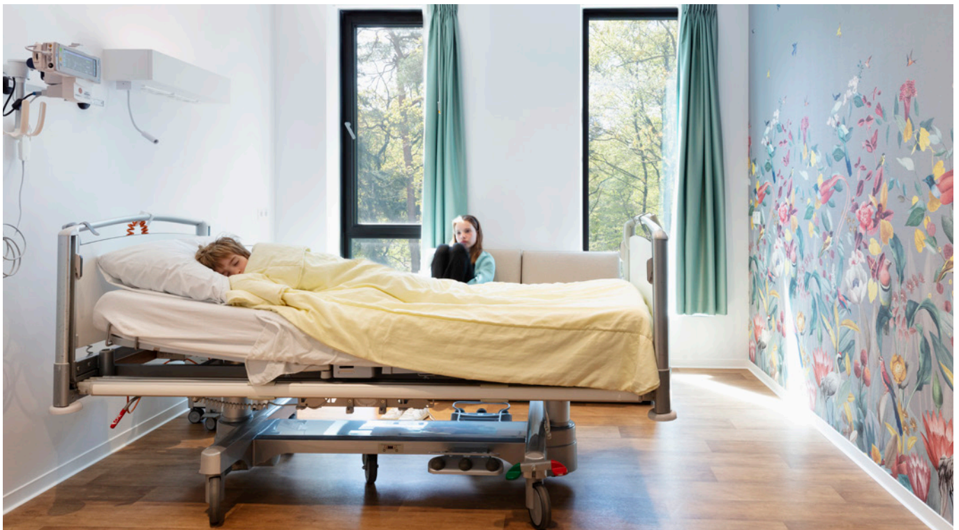
Patiëntenkamer op de kinderafdeling

Het resultaat is een verpleegafdeling waarin de patiënt en zijn herstelproces centraal staan, maar niet zonder het zorgproces voor de medewerker ook optimaal te faciliteren. Zacht en hard gaan ook hier vloeiend in elkaar over, waardoor patiënten sneller herstellen, er minder kans op infecties zijn én daarmee het aantal ligdagen verminderd zal worden.