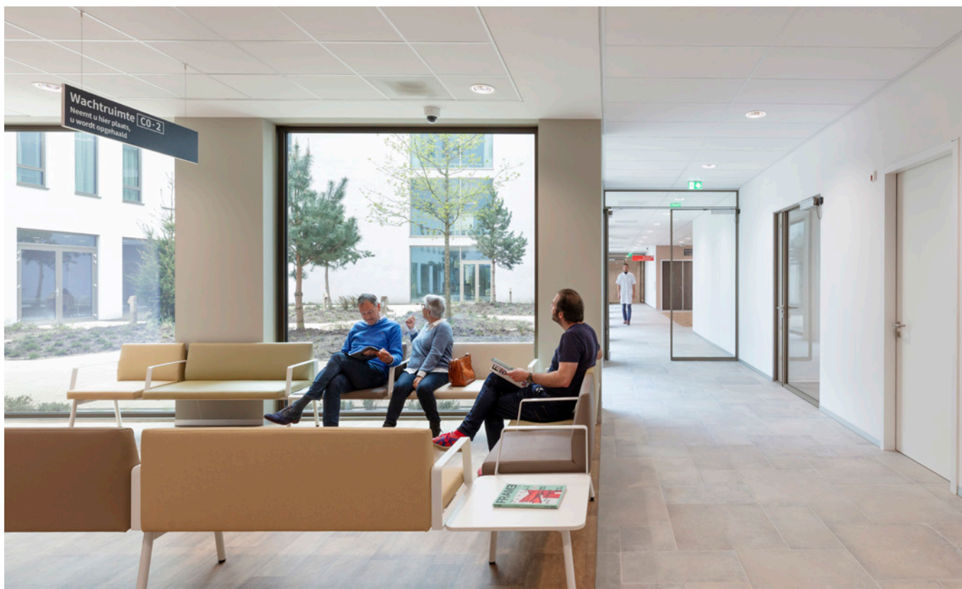
Wachtruimte polikliek met zicht op één van de patio's