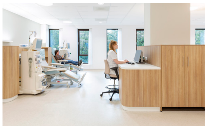
De dialyzezaal heeft ruim uitzicht op de bosrijke omgeving

zonnige dagen gevoelsmatig echt tussen de natuur de behandeling te ondergaan. Frisse lucht, zingende vogels en het ruisen van de bladeren in de wind geven een serene sfeer aan een emotioneel veeleisende behandeling. Zo vloeit de wereld van de hoogwaardige medische technologie samen met het welzijn van de patiënt. Werelden die elkaar niet tegenspreken, maar juist versterken.