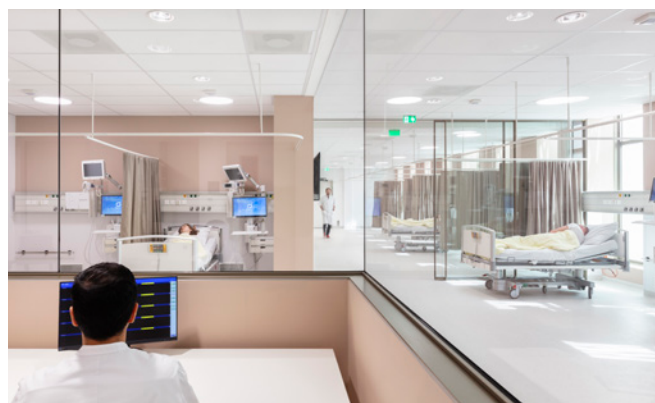
Daglichttoetreding op de holding/verkoeverruimte

De diverse OK's en andere ruimten binnen het complex kennen een grote mate van standaardisatie in inrichting. Tevens is er aandacht besteed aan de positie en grootte van bergingen, waardoor hulpmiddelen nooit ver weg zijn. Zo wordt niet alleen het werkplezier van de professional vergroot, maar ook een veilige en kwalitatief hoogwaardige zorgverlening.