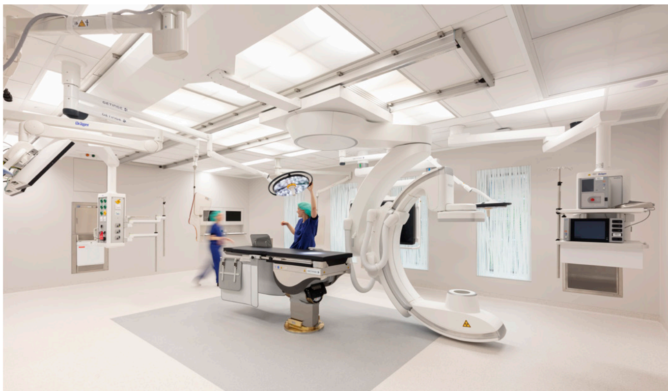
Een van de hybride OK's