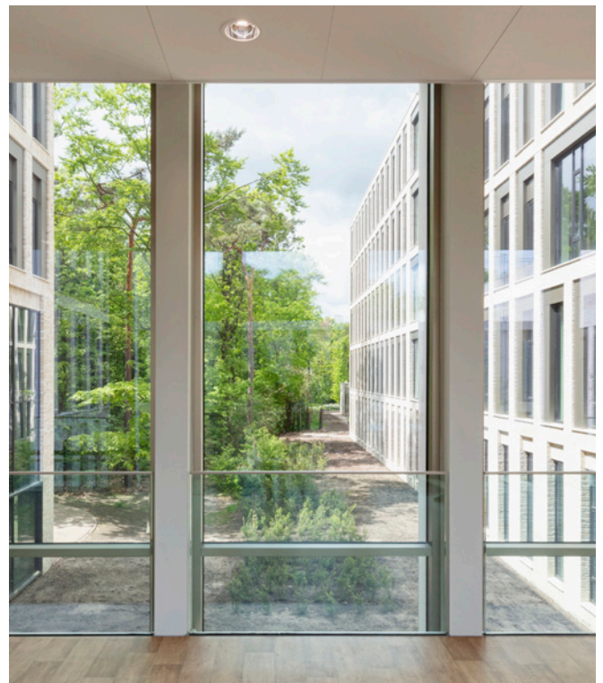
Een van de serre-achtige corridors in de centrale passage