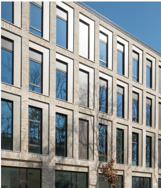
De gevel is opgebouwd uit baksteen, aluminium, beton en glas

De reductie tot vier materialen (baksteen, aluminium, beton en glas), de aangename proporties en geleiding, het verfijnde ritme in de gevel geeft het gebouw een robuuste maar tegelijkertijd ook zeer elegante en transparante verschijning. Het resultaat is een tijdloze schoonheid passend in het parklandschap. Architectuur zoals architectuur bedoeld is.