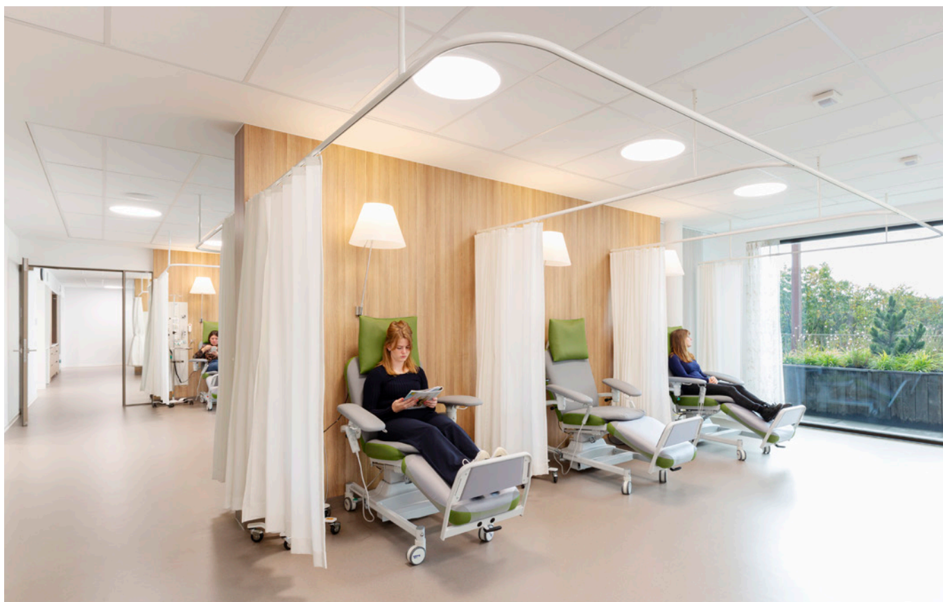
Dagbehandeling oncologie met balkon biedt panorama zicht op de bosrijke omgeving