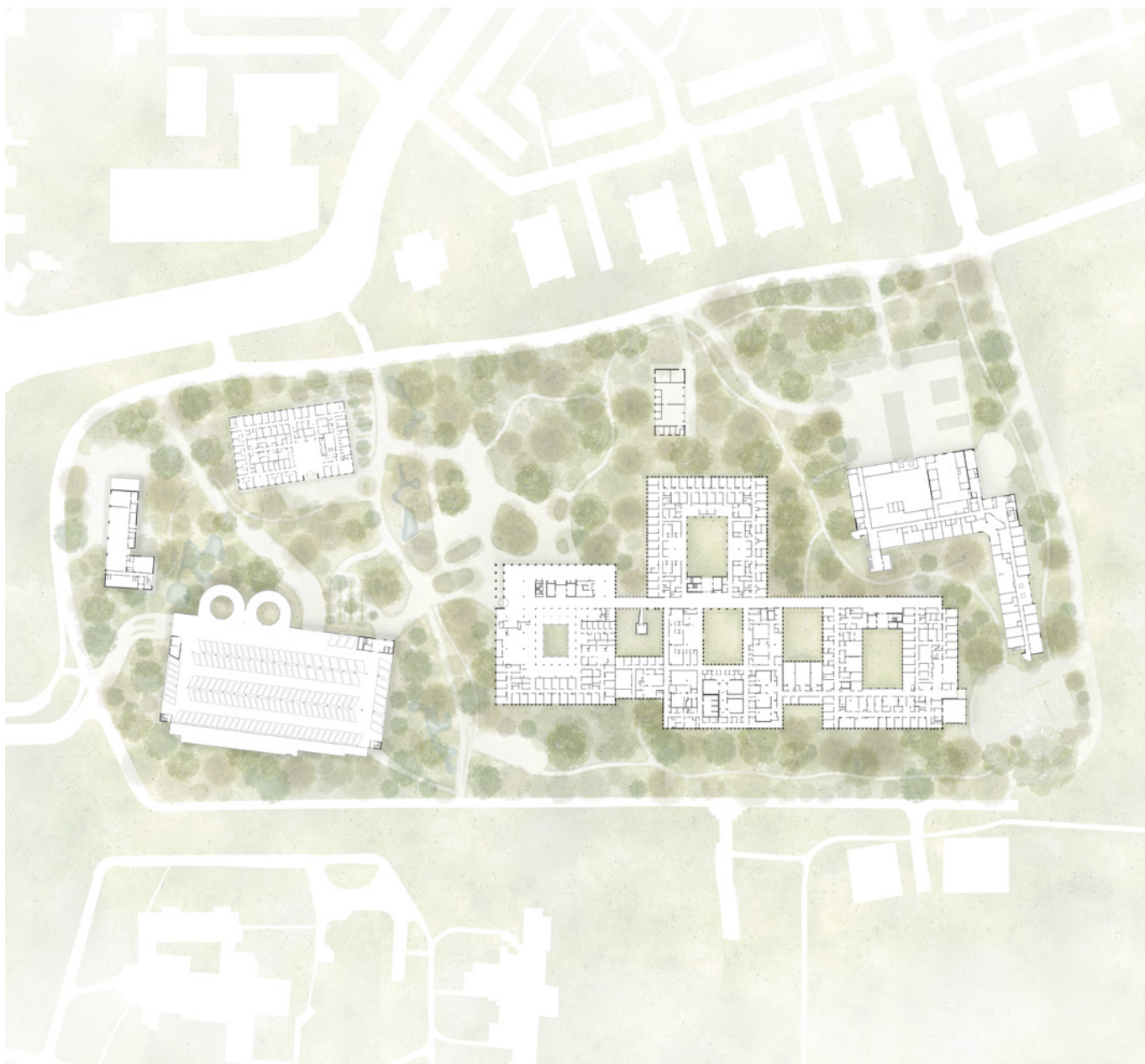
Het ziekenhuis heeft zes patio's en is omringd door bosrijke omgeving

Door de medische vooruitgang in de decennia daarna ontwikkelden zorggebouwen zich meer en meer tot technologische gezondheidsfabrieken waarin zachtere factoren als gevoel, rust en ontspanning een verminderde rol speelden. Onderzoek heeft echter geleerd dat deze factoren een veel grotere en zelfs doorslaggevende rol kunnen spelen in het genezingsproces. Honderd jaar na Zonnestraal is dit motief relevanter dan ooit en speelt de nieuwbouw van Tergooi MC daar als één van de eerste ziekenhuizen op in.